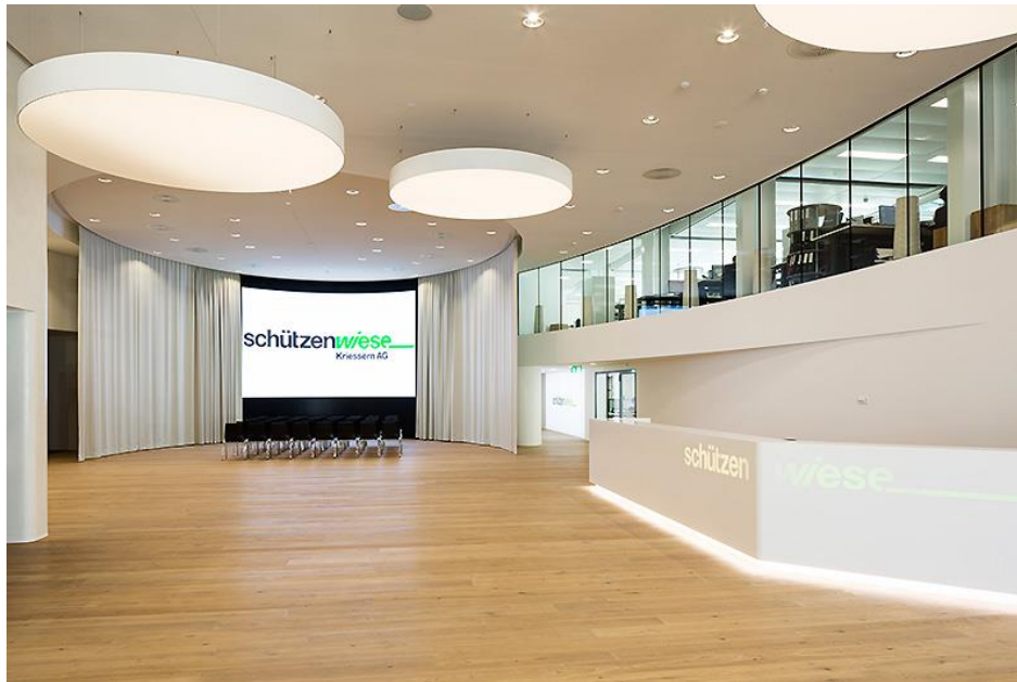
Empfang – Foyer

Platz für bis zu 150 Personen (Multimedialeinwand)