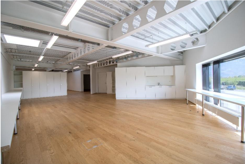
Hauptteil mit Fensterfront Südosten